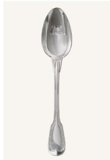
La cuillère de Paris

VENTE PRADA ET MIU MIU VINTAGE #1 CHEZ PENELOPE'S. DU 8 AU 18 NOVEMBRE. ESTIMATIONS : 80 À 1 000 € PAR PIÈCE. PENELOPESAUCTION.COM